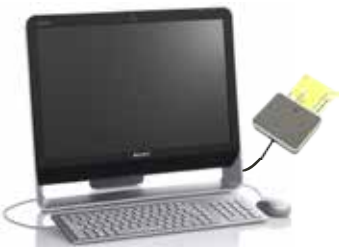
Avec la carte entreprise et votre ordinateur, récupérez les données sociales sur votre PC.