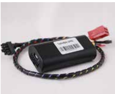
Plus de temps perdu pour récupérer physiquement les fichiers !

Les fichiers sont reçus aux formats standards C1B et V1B, compatibles avec la majorité des logiciels de données sociales.